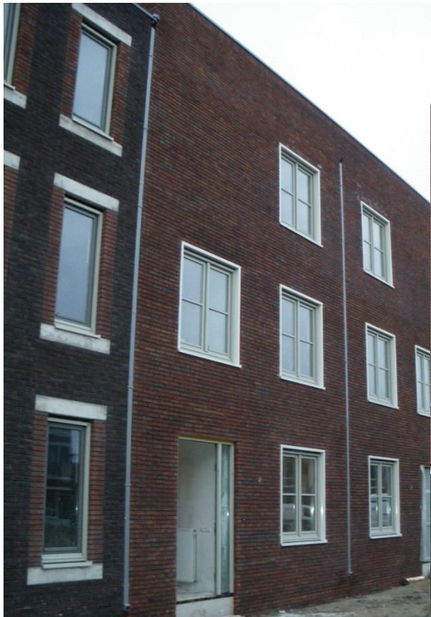
Afbeelding 3 Foto voorgevel