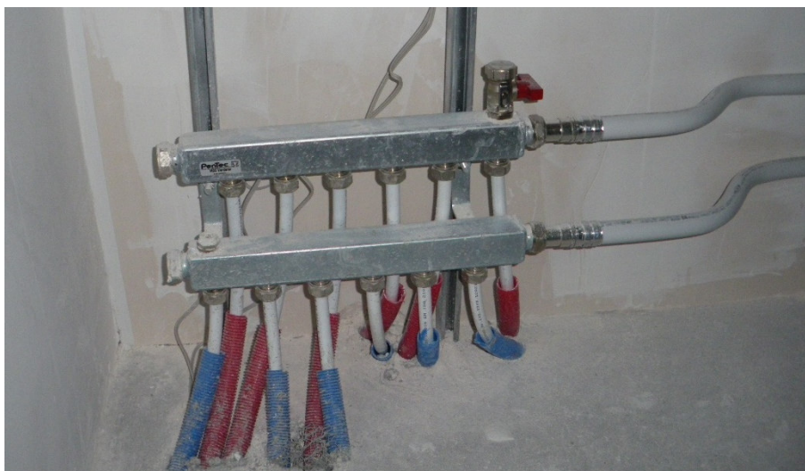
Afbeelding 10 Foto van de distributie (in bergkast, begane grond)

Alle ruimten worden op dezelfde wijze verwarmd. Alleen in de berging op de 2 e verdieping is geen afgiftesysteem aanwezig. De leidingen in deze ruimte zijn ongeïsoleerd. Verder zijn er buiten de rekenzone geen verwarmingsleidingen aangetroffen. De bediening van de verwarming bevindt zich in de woonkamer. Volgens de woningeigenaar is de verwarmingsinstallatie ingeregeld. Er kan alleen geen rapport overlegd worden.