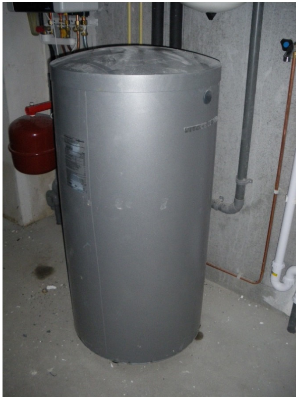
Afbeelding 14 Foto's van het boilervat en de apparatuur in de berging

In de woning is verder geen elektrische boiler of geiser aangetroffen. De leidingen naar de warm tapwaterpunten zijn uitgevoerd in koper met een buitendiameter van 12 mm. Volgens de software is de jaarlijkse netto energiebehoefte voor tapwater 7.950 MJ.