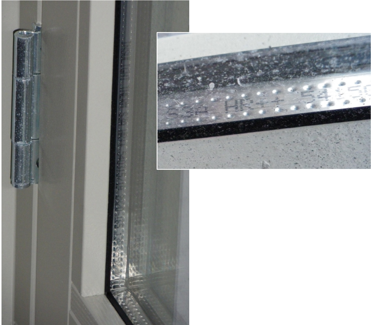
Afbeelding 7 Foto's van kozijn en glas

Alle beglazing zijn wat type glas en kozijn betreft gelijk. Er zijn geen vanuit binnen bedienbare buitenzonweringen aanwezig.